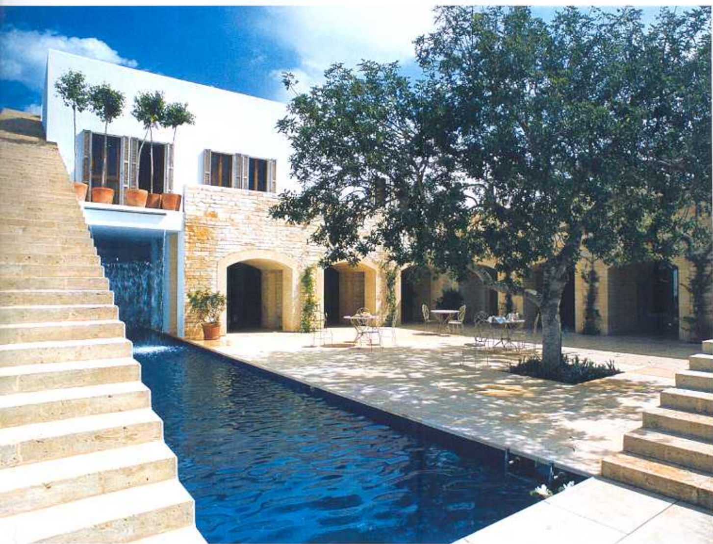
Invernizzi / Invernizzi/Studio

bero ombreggiare o sporcare l'acqua, seguire l'orientamento del sole per consentire il maggior soleggiamento durante l'intero arco del giorno e prevedere la necessaria collocazione dei locali tecnici. Dati questi primi elementi, si può lasciare libera la fantasia. Per i rivestimenti interni si possono scegliere, per esempio, le tessere a mosaico, che consentono infinite declinazioni di colori, sfumature e disegni, per armonizzare perfettamente la piscina all'ambiente cir-