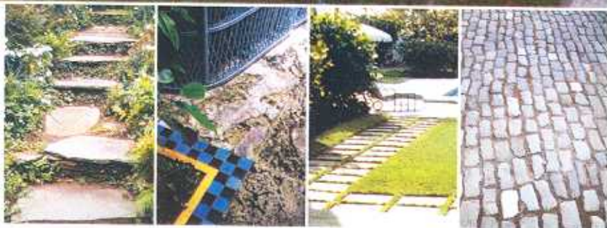
Le piscine (a pag. 104) sono state realizzate da Barbara Baccaruto/Alamy, da Cristina Pizzarello/Alamy

nascosto alla vista si può ottenere il caratteristico effetto specchio, con il cielo o il giardino circostante che si riflettono nell'acqua , all'apparenza immobile. Per ottenere i migliori risultati possibili, è importante riservare una particolare attenzione a questo sistema, che va adattato alla forma della vasca e al contesto paesaggistico. Allo stesso modo, è necessario tener presente le istanze di rispetto per il paesaggio e per la riduzione dell'inquinamento. Si stanno, a questo proposito, affermando nuove metodologie di filtrazione e disinfezione dell'acqua, che abbandonano il tradizionale cloro, a tutto vantaggio